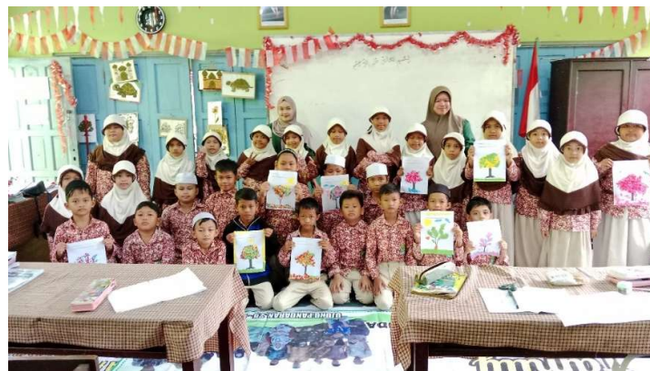
Gambar 5. Hasil Karya Seni Rupa