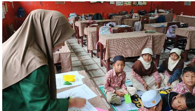
Gambar 2. Memberikan contoh pembuatan kolase

Kemudian kegiatan selanjutnya memberikan contoh pembuatan kolase imajinatif. Adapun Langkah- Langkah pembuatannya: (1) Menyiapkan lembar kolase imajinatif, (2) Menggunting kertas origami menjadi potongan-potongan kecil, (3) Mengoleskan lem ke lembar kolase berbentuk batang pohon, (4) Kemudian menempelkan potongan kertas ke lembar kolase yang sudah diberikan lem. Melalui kegiatan ini dapat menunjukkan peningkatan dalam aspek ketelitian dan konsentrasi siswa. Siswa juga dapat mengasah kemampuan imajinasi yang mereka miliki, sehingga dapat menghasilkan sebuah karya yang kreatif.