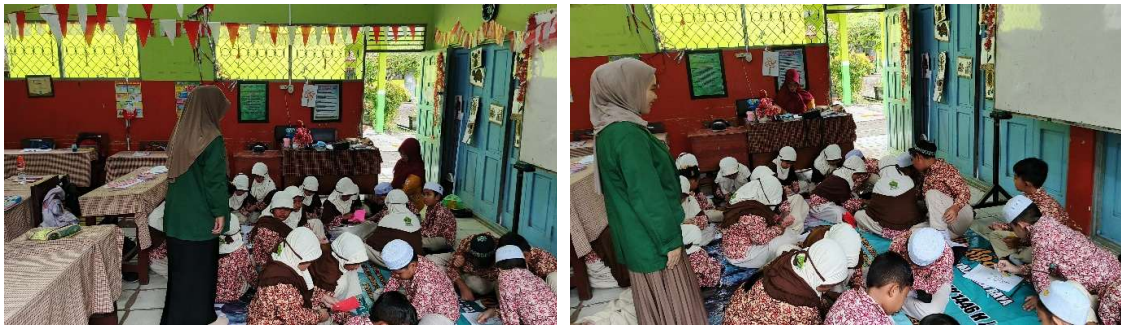
Gambar 3. Mendampingi kegiatan pengerjaan kolase

Setelah seluruh proses pengerjaan selesai, kegiatan terakhir yang dilakukan adalah mendokumentasikan hasil karya siswa. Dokumentasi ini dilakukan sebagai bentuk apresiasi terhadap kreativitas dan usaha siswa.