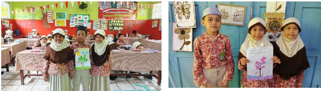
Gambar 4. Dokumentasi Hasil Karya siswa

Setelah seluruh proses pengerjaan selesai, kegiatan terakhir yang dilakukan adalah mendokumentasikan hasil karya siswa. Dokumentasi ini dilakukan sebagai bentuk apresiasi terhadap kreativitas dan usaha siswa.