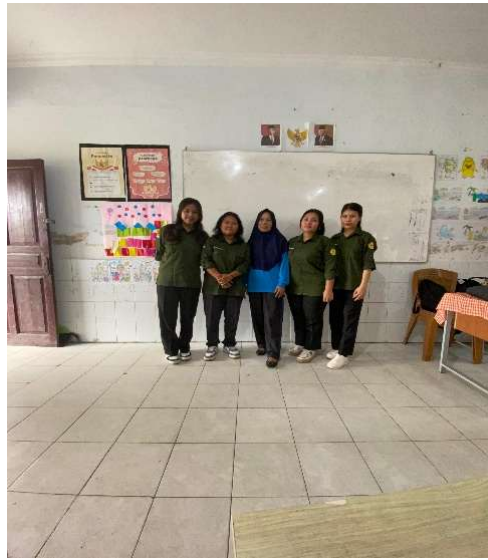
Gambar 2. Foto bersama dengan guru SDN 066050 Medan Denai