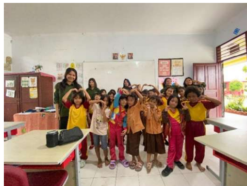
Gambar 3. Foto bersama dengan guru beserta siswa SDN 066050 Medan Denai