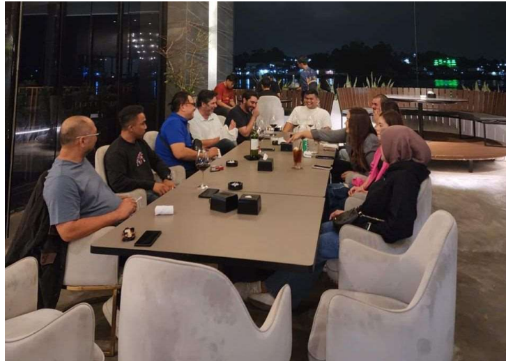
Gambar 4. Kegiatan Gathering

karyawan menunjukkan antusiasme terhadap kegiatan ini. Gathering memberikan kesempatan bagi karyawan untuk sejenak keluar dari rutinitas kerja dan berkontribusi pada terciptanya suasana kerja yang lebih harmonis.