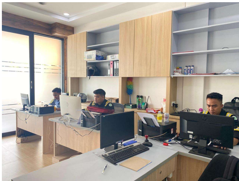
Gambar 3. Pendistribusian Minuman Vitamin dan Susu

Selain itu, kegiatan gathering bulanan juga telah dirancang untuk mendukung kesehatan mental dan mempererat hubungan sosial antar karyawan. Gathering ini mencakup aktivitas seperti makan bersama dan berbagai kegiatan rekreasi di tempat yang nyaman. Tingginya tingkat partisipasi