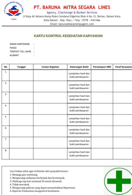
Gambar 1. Kartu Kesehatan Karyawan

Program lain yang telah diimplementasikan adalah distribusi minuman vitamin You C1000 dan susu Bear Brand. Minuman vitamin dibagikan setiap tiga hari sekali, sedangkan susu diberikan setiap pagi sebelum jam kerja dimulai. Program ini bertujuan untuk menjaga daya tahan tubuh dan meningkatkan stamina karyawan, terutama bagi mereka yang menjalani pekerjaan dengan tuntutan fisik tinggi. Pelaksanaannya dilakukan secara konsisten setiap harinya dengan memastikan bahwa semua karyawan mendapatkannya. Sebagai hasilnya, sebagian besar karyawan mengatakan bahwa adanya peningkatan energi dan penurunan rasa lelah selama bekerja, selain itu mereka juga lebih merasa diperhatikan oleh perusahaan.