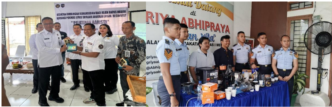
Gambar 4. pelaksanaan praktik pelatihan barista