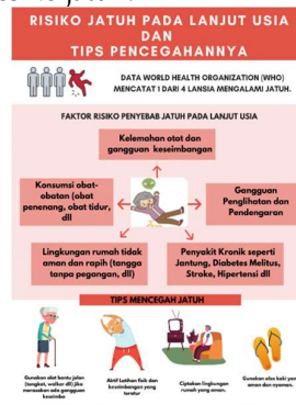
Gambar 3. Poster resiko jatuh

Para peserta mendengarkan dengan seksama terhadap materi-materi, yaitu pengertian, faktor penyebab,serta pencegahan terhadap pengetahuan pencegahan resiko jatuh . Peserta sangat antusias dengan materi yang disampaikan karena sebelumnya materi tersebut masih belum mereka ketahui. Selain itu materi yang disampaikan menjadi sangat menarik karena didukung dengan adanya gambar pada poster. Kemudian setelah itu dilakukan diskusi tanya jawab antara pelaksana dan peserta. Peserta merasa senang dan menambah pengetahuan mereka tentang bagaimana cara pencegahan pada kasus pencegahan resiko jatuh.