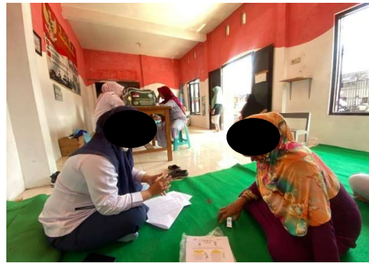
Gambar 2. Pemberian Edukasi

Kegiatan pemberian edukasi fisioterapi tentang edukasi kesehatan dalam meningkatkan pengetahuan pencegahan resiko jatuh di posyandu lansia melati turi kepuharjo ,kec Karangploso berjalan dengan baik dan lancar. Pada saat penyuluhan mendapatkan banyak respon yang baik dari para lansia yang berhadir pada saat posyandu berlangsung dengan jumlah peserta sekitar kurang lebih 15-21 orang lansia.