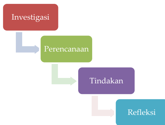
Gambar 1. Langkah-langkah Metode Service Learning

Model Service Learning (SL) memiliki keunggulan dalam membantu siswa mencapai tujuan pembelajaran secara menyeluruh, memberikan rasa kepuasan diri, serta memungkinkan mereka belajar sambil bekerja. Dengan demikian, model ini dapat memotivasi siswa untuk lebih aktif dalam proses belajar. Selain itu, penerapan model ini memungkinkan siswa untuk berinteraksi langsung dengan lingkungan sekitar, sehingga mereka memperoleh pengalaman nyata yang memperkaya pemahaman mereka (Ardani et al., 2016). Berikut langkah-langkah metode service learning (SL) yang diterapkan dalam penelitian ini dilakukan dengan mengikuti tahapan (1) investigasi, (2) persiapan, (3) tindakan, dan (4) refleksi (Achmadi & Z.Nasution, 2021).